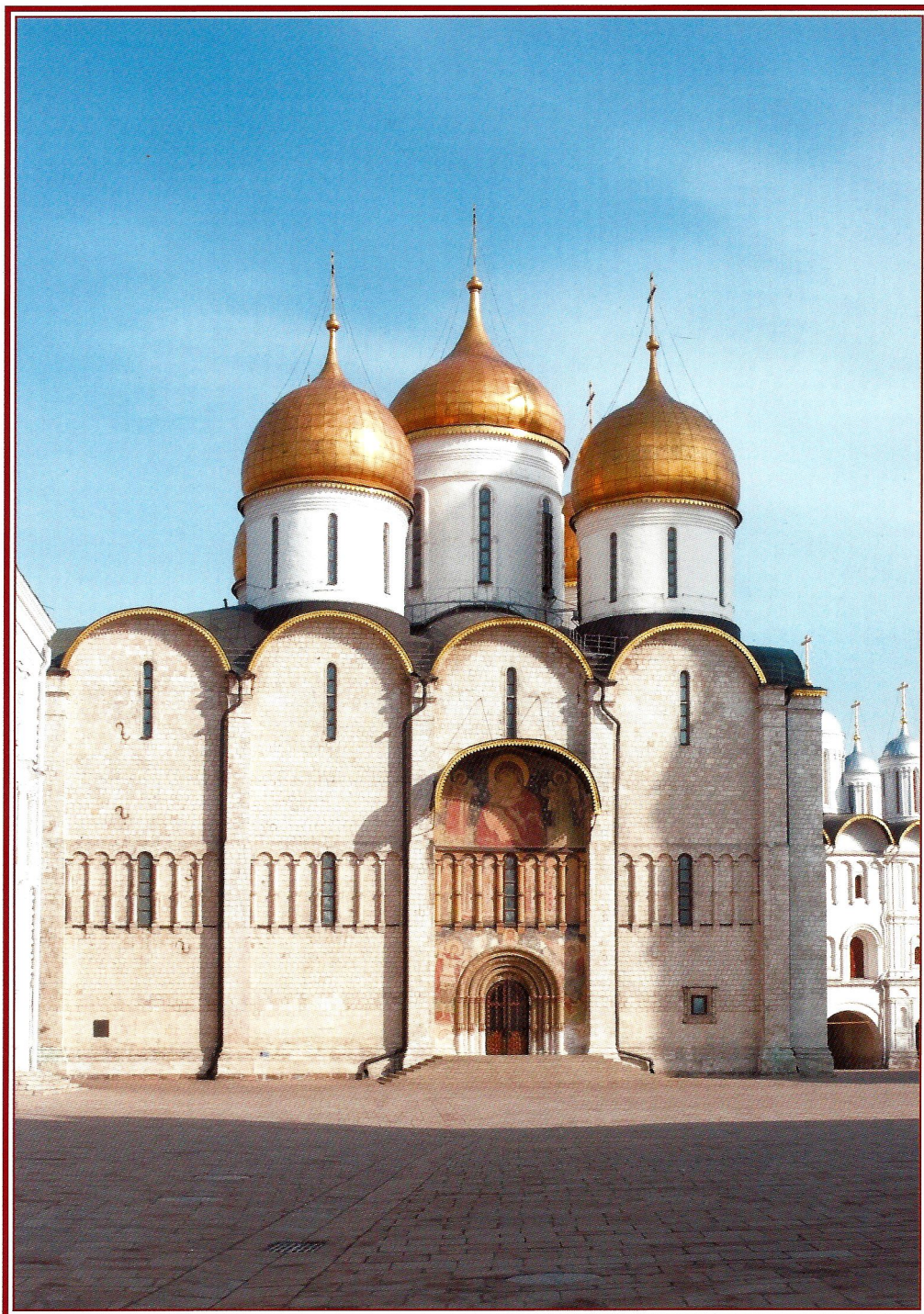
УСПЕНСКИЙ ПАТРИАРШИЙ СОБОР МОСКОВСКОГО КРЕМЛЯ